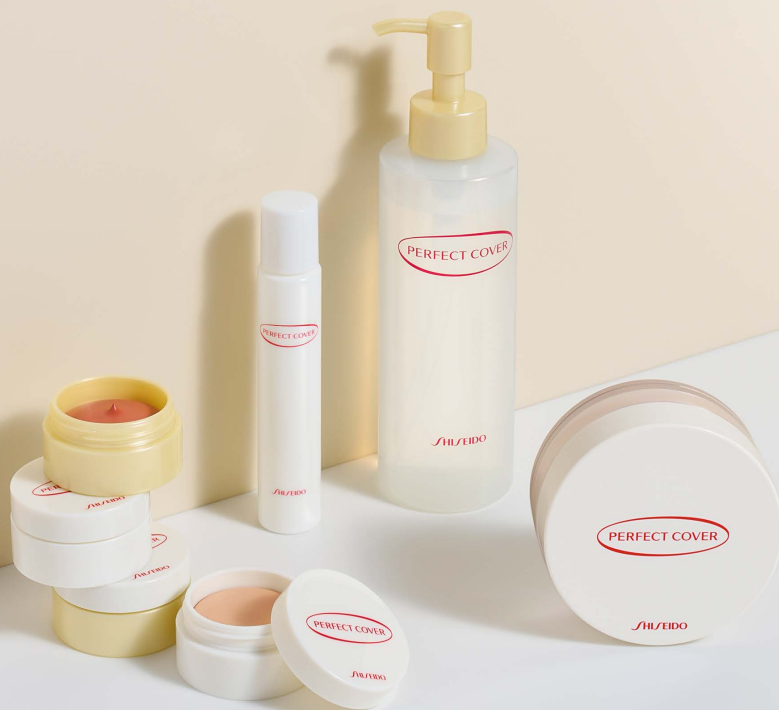
資生堂 ライフクオリティー メイクアップ専用商品 パーフェクトカバーシリーズ

資生堂 ライフクオリティー メイクアップはあざや白斑、やけど跡や傷跡、病気や治療による見た目の変化など、肌に深いお悩みのある方々を「化粧のちから」で支援する社会活動です。