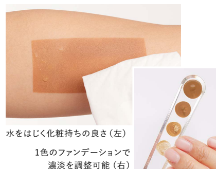
水をはじく化粧持ちの良さ(左)

を両立しています。これは油と粉末が合わさることで生まれる2層タイプならではの使い心地ですね。