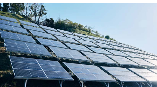
工場敷地内のソーラーパネル

そのため、大量生産であっても、使う方一人ひとりにとっては大切な一本。特に「パーフェクトカバー」は、肌に深いお悩みのある方々に寄り添う社会的な意義の大きいブランドだと感じています。長くご愛用いただいているお客さまの期待にお応えできるよう、これからも一つひとつの製品に真摯に向き合い、丁寧なモノづくりを続けていきたいですね。