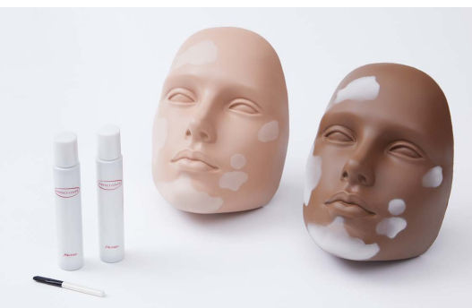
グローバルなスキントーンに対応