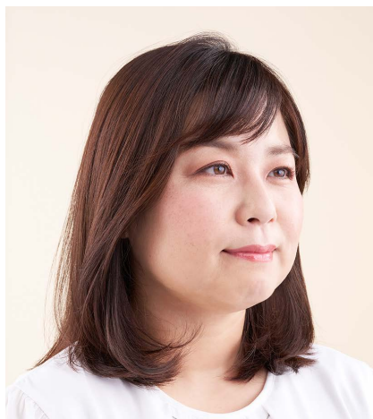
AFTER ファンデーション VC n でカバーした仕上がり