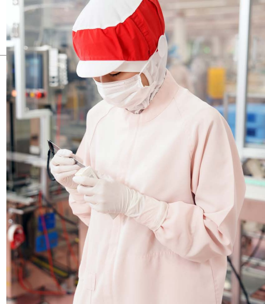
生産ラインでの検品の様子。一つひとつ丁寧に製品を確認

クを確実にしています。安全性・安定性・使い心地の全てにおいて妥協しないモノづくりを徹底するためです。