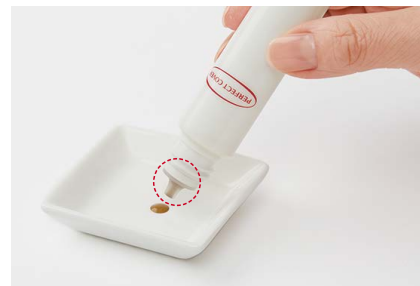
リニューアルしたボトルの先端

お客さまより「冬場にキャップを開けた際に、液体が溢れてくる」というお声をいただいたことがありました。これは、気温の変化などにより容器内の圧力が変わることによって生じるリキッドタイプのファンデーションならではの課題