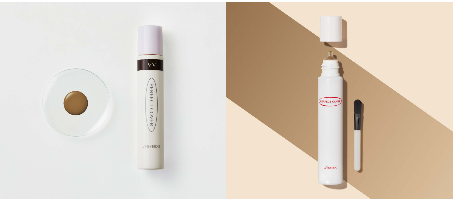
初代白斑用ファンデーション（左）と現在の製品（右）