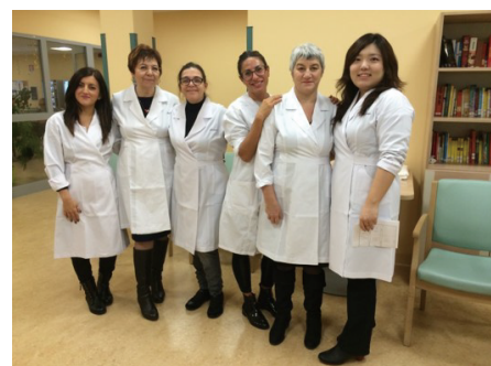
資生堂コスメティチ（イタリア）の社員たち