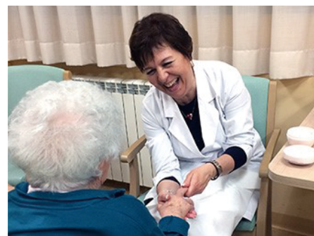
ハンドマッサージの様子

参加した社員自身も、皆さんの笑顔が嬉しく、毎回とても温かい気持ちになっています。