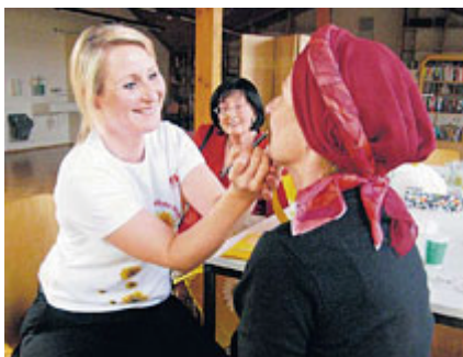
ドイツ 医療機関でのセミナーの様子