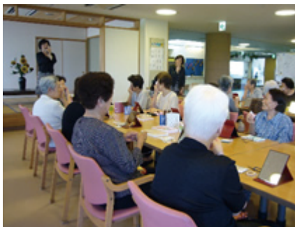
日本 高齢者福祉施設でのセミナーの様子

主に介護事業所や障がい者施設、学校、企業などを訪問し、スキンケアやメーキャップを行うことで、「化粧の力」を実感いただいたり、社会人としての身だしなみを学んでいただく「資生堂ライフクオリティービューティーセミナー」は、2013年7月より「資生堂ライフクオリティー事業」として超高齢社会の抱える課題解決にも貢献するサステナブルな活動を展開してきました。