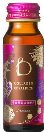
ベネフィーク コラーゲン ロイヤルリッチ<ドリンク>N

この秋ベネフィークは、お客さまのニーズに合わせて幅広い美容ソリューションを提案する「総合美容ソリューション」へ進化します。