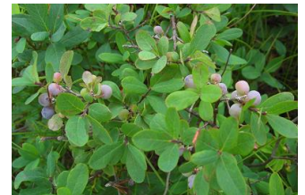
プラチナベリー(クロマメキ)

※「プラチナベリー(クロマメノキ)」は資生堂が研究開発し、美容効果を確認した独自素材です。