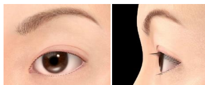
<日本人のまつ毛の平均値を再現>

※ 調査対象者自身が、まつ毛の本数・長さ・角度・形を直接モニター画面に書き込むことができる、資生堂が独自に開発したシステム