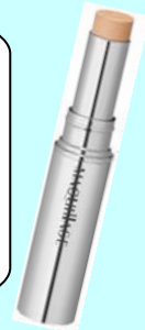
メイクアーティストコンシーラースティックEX (SPF25・PA++)