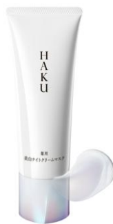
薬用 美白ナイトクリームマスク (医薬部外品)

※2 4-メトキシサリチル酸カリウム塩 ※3 グルタチオン・グリセリン(整肌・保湿)