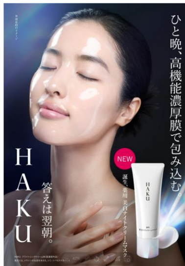
HAKU 薬用 美白ナイトクリームマスク（医薬部外品）キービジュアル