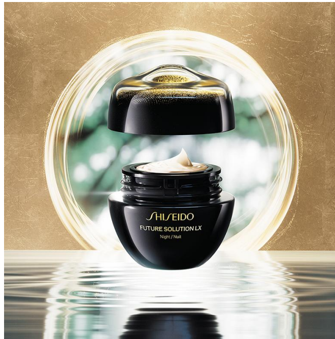
〈26 年キービジュアル〉

心地よい香りと、とろけるようなテクスチャーで心地よく五感を満たしながら、ハリと輝きのあふれる肌へ導き「年齢を重ねるごとに美しくあり続ける肌」を目指します。