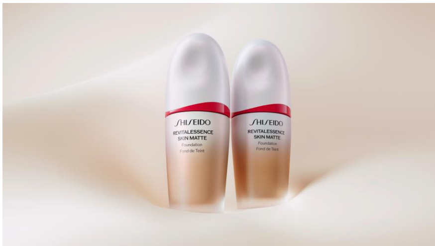
SHISEIDO エッセンス スキンスムース ファンデーション

*毛穴落ちのなさ・よれのなさ・うすれのなさ・テカリのなさ・化粧崩れのなさ (当社調べ。効果には個人差があります。)