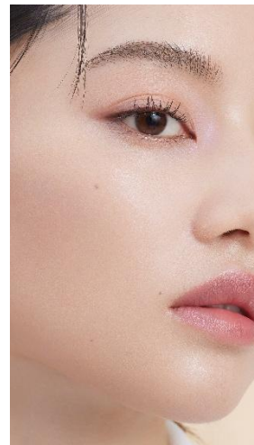
(仕上がりイメージ)