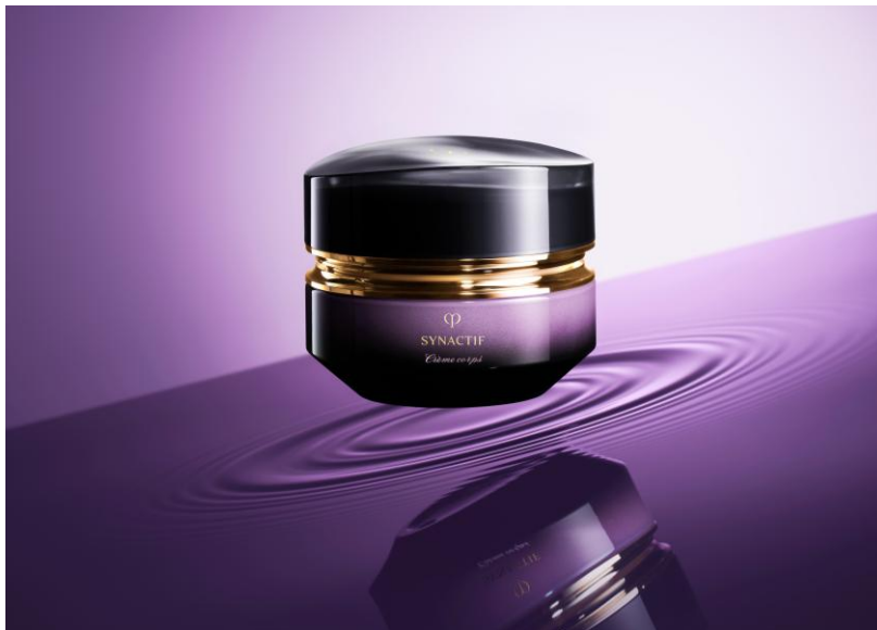
【クレ・ド・ポー ボーテ シナクティブ クレームコール】

* 2 ヒアルロン酸Na、塩化Na、ラウリルジメチルアミノ酢酸ペタイン、オウゴン根エキス、パルミトイルトリペプチド-1、パルミトイルテトラペプチド-7、グリセリン