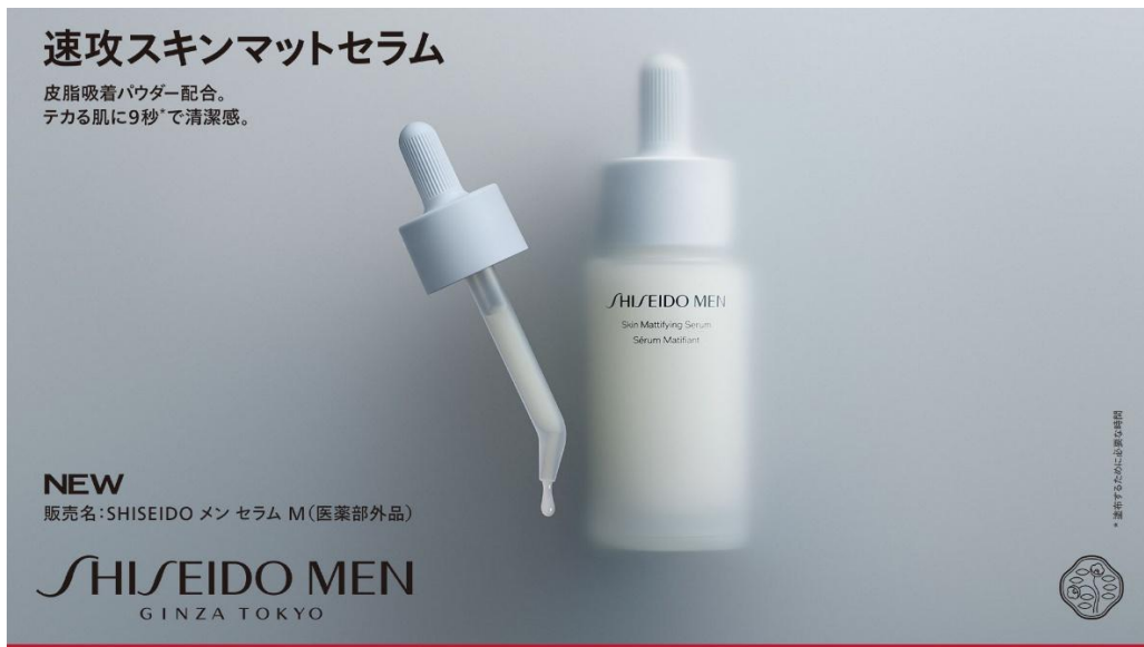
「SHISEIDO MEN スキンマットセラム」