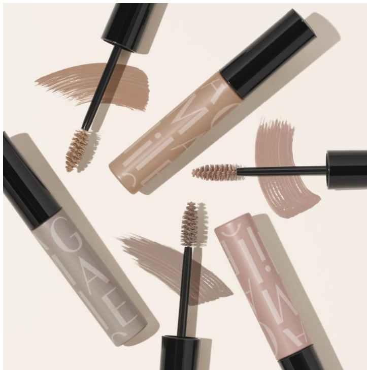
マキアージュ アイブロウカラーマスカラ