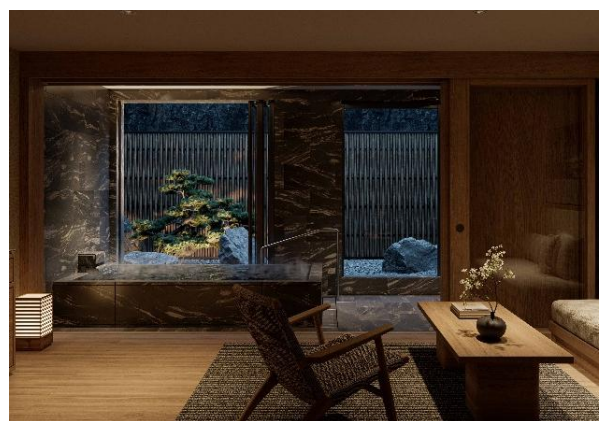
Auriga Spa (アウリガスパ) 温泉ルーム