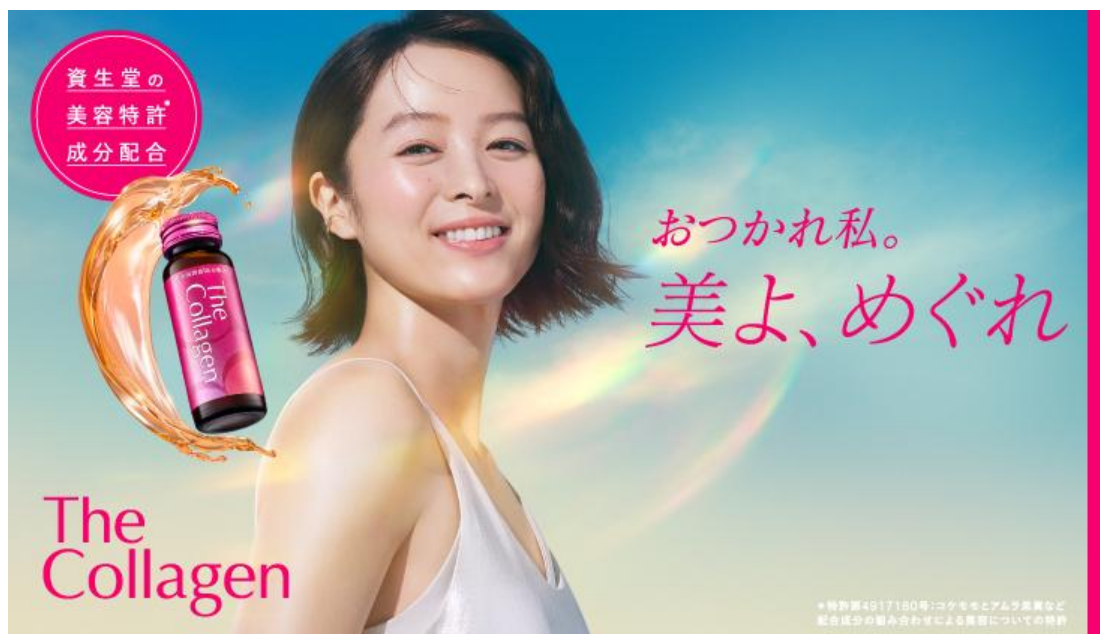
女優の清野菜名さんを起用した新広告ビジュアル

資生堂グループのインナーケアブランド「ザ・コラーゲン」は、2026 年 2 月に誕生から 30 周年を迎えます。1996 年の誕生以来、忙しい毎日を生きる女性たちの“おつかれ”に寄りそいながら、内側から美しさと前向きな気持ちを支えてきました。30 周年という節目にあたり、新キーメッセージ「おつかれ私。美よ、めぐれ」のもと、ブランドサイトをリニューアルするとともに、これまでの感謝の気持ちをこめて SNS キャンペーンを展開します。