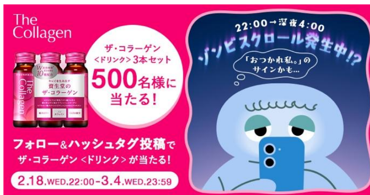
キャンペーン広告ビジュアル