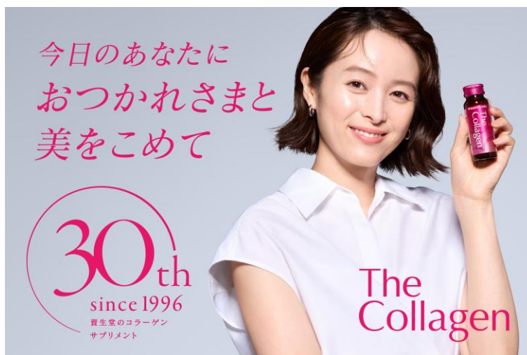
30周年を記念した広告ビジュアル

30周年を迎えるにあたり、「ザ・コラーゲン」ブランドサイトをリニューアル。ブランドの歩みや想い、「おつかれ私。美よ、めぐれ」に込めたメッセージを通じて、「ザ・コラーゲン」の世界観をより深く体感いただけるサイトへと生まれ変わります。