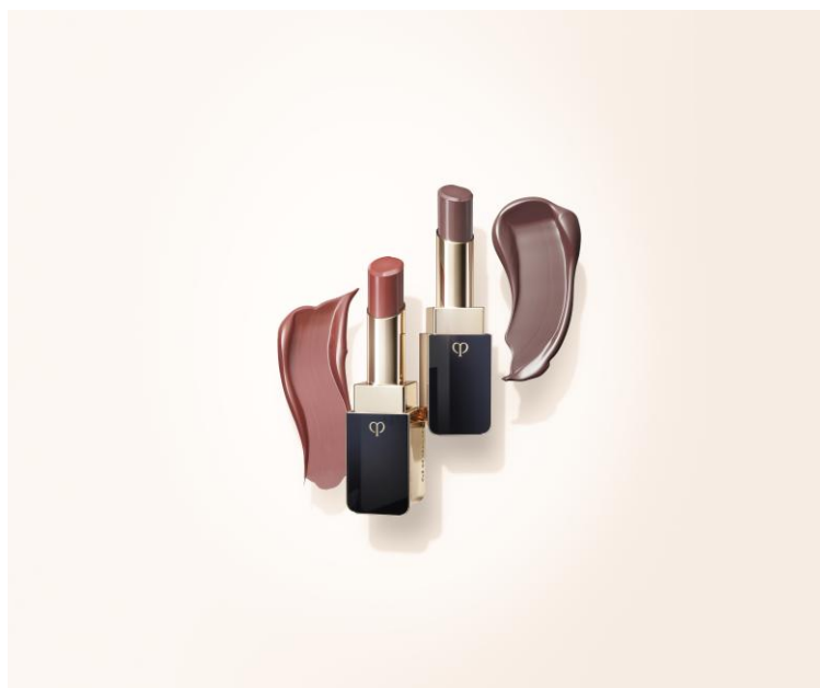
クレ・ド・ポー ボーテ ルージュアレーブル ブリアン新色