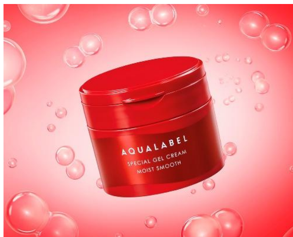
アクアレーベル スペシャルジェルクリーム EX (モイストスムース)

※1 グリコール酸、グリセリン(保湿) ※2 D-アスパラギン酸、グリセリン(ハリ保湿) ※3 水溶性コラーゲン、グリセリン(保湿) ※4 アセチル化ヒアルロン酸 Na、ヒアルロン酸 Na(保湿) ※5 D-グルタミン酸、DL-アラニン、DL-メチオニン(うるおい保持)