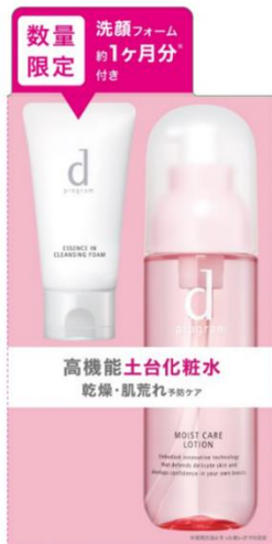
d プログラム モイストケア ローション MB 限定セット e (医薬部外品)