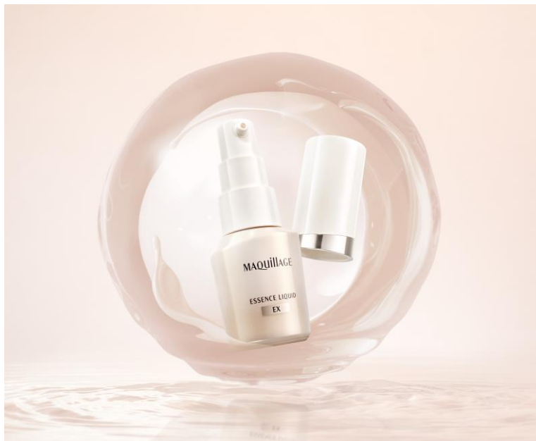
マキアージュ エッセンスリキッド EX

※1 インテージ SRI+ ファンデーション市場(リキッド形状) 期間:2023/10～2024/9 推計販売規模(金額) ブランドランキング