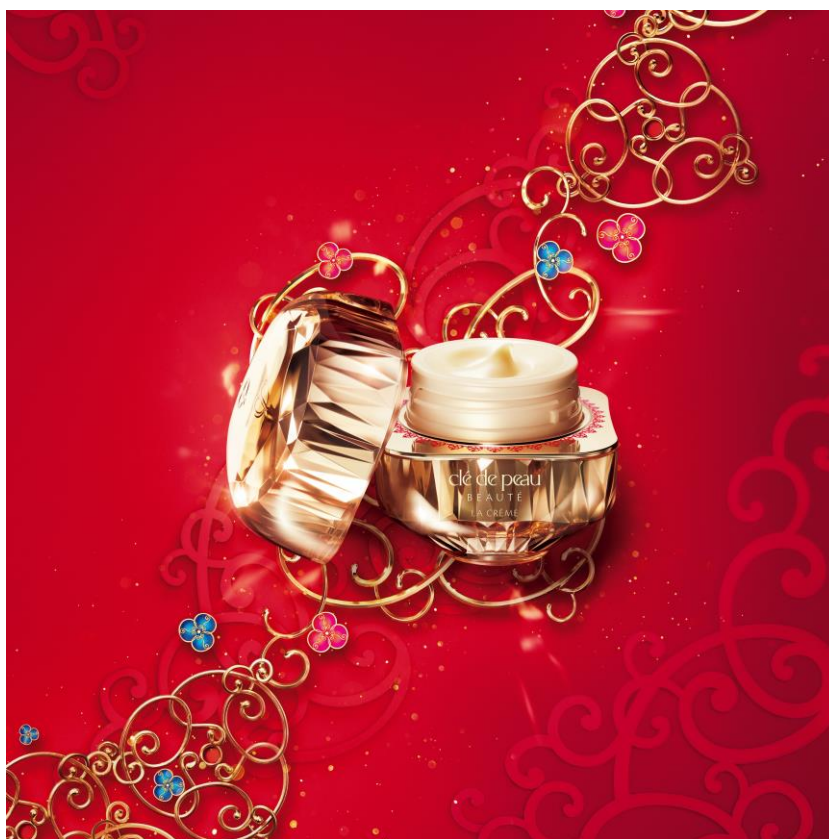
【クレ・ド・ポー ボーテ ラ・クレーム】

資生堂のグローバルラグジュアリーブランド「クレ・ド・ポー ボーテ」は、美とサイエンスを結集した、ブランドを象徴するハイパフォーマンスクリーム「ラ・クレーム」限定サイズ・限定パッケージ【全1品 参考小売価格 91,300円(税込)】を2025年1月21日(火)に発売します。伝統のエナメルアート“瑠璃彩(ほうろうさい)”をインスピレーションに、幸運を呼ぶ吉祥模様とジュエリーを融合させたモチーフがパッケージを彩ります。