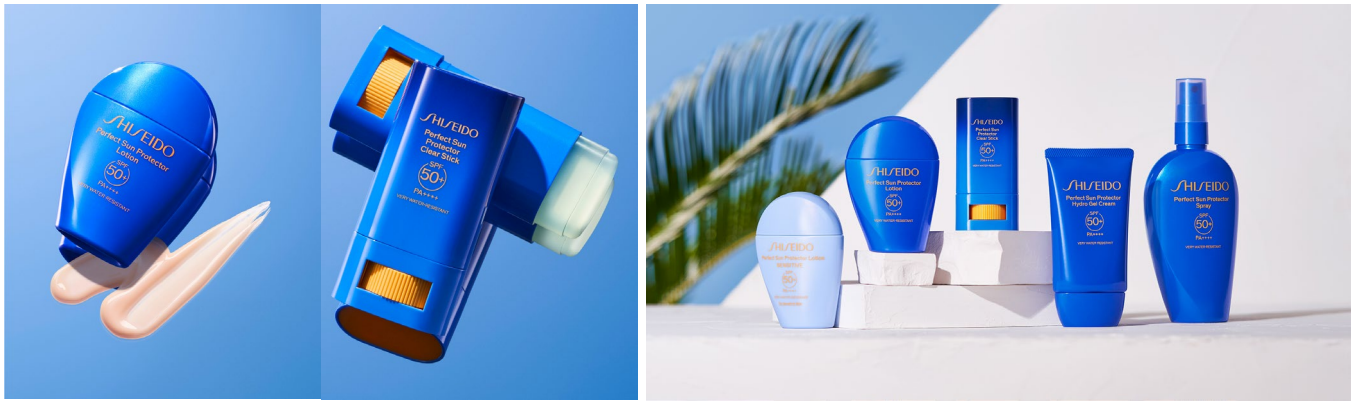
【SHISEIDO サンスキンケアシリーズ】