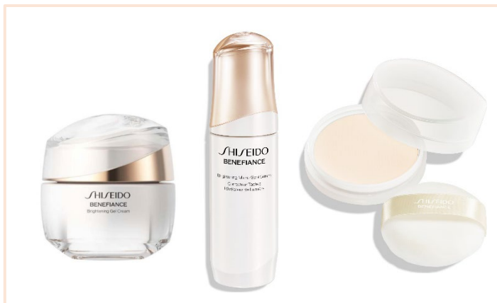
新ブライトニングケア