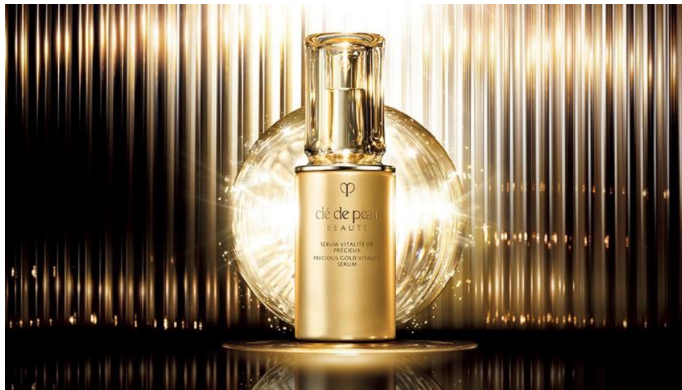
クレ・ド・ポー ボーテ セラムヴィタリテオープレシユ