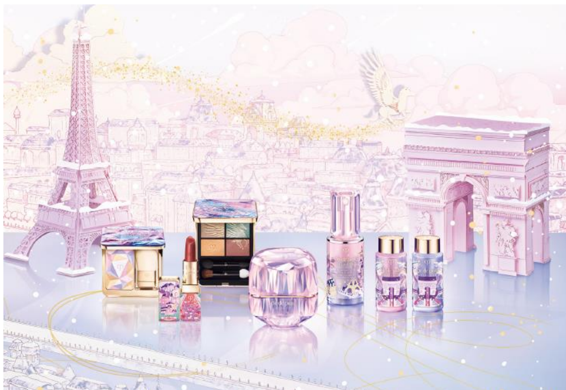
【クレド・ポー ボーテ ホリデーコレクション】