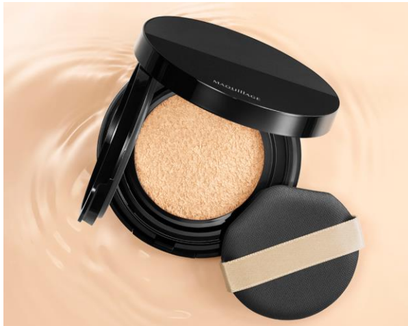
マキアージュ ドラマティックエッセンスクッション グロウ

※1 グリシルグリシン・グリセリン(整肌・保湿)、ウォーターリーキープエッセンス(ウォーターリリーエキス・スーパーヒアルロン酸(アセチルヒアルロン酸Na)・水溶性コラーゲン・グリセリン)配合(保湿)