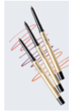
マキアージュ ドラマティックエッセンスライナー 【定番3色・限定3色】