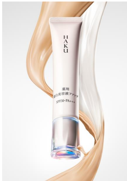
【HAKU 薬用 美白美容液ファンデ (医薬部外品)】