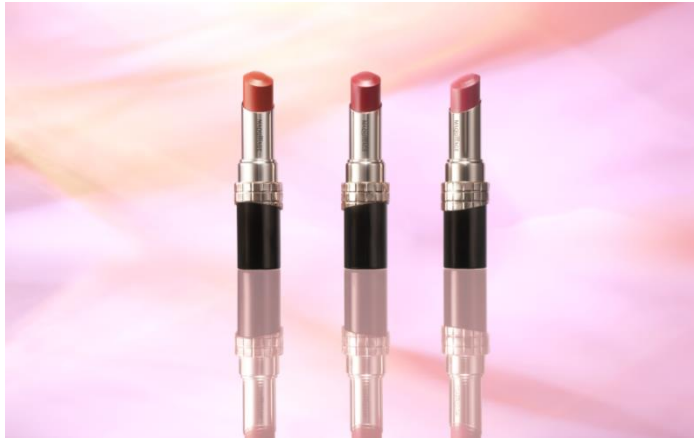
マキアージュ ドラマティックエッセンスルージュ 【数量限定 3色】

※2 8時間 仕上がり持続 ※ データ取得済み ※色・つや・なめらかさ(当社調べ。効果には個人差があります)