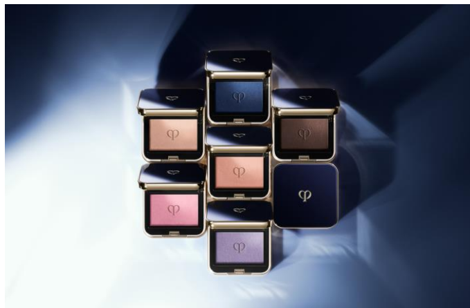
クレ・ド・ポー ボーテ オンブルクルールソロ

※3 加水分解シルク、加水分解コンキオリン、テアニン、トウキエキス、シソエキス、グリシン、グリセリン、PEG/PPG-14/7ジメチルエーテル、トレハロース、水添ポリデセン