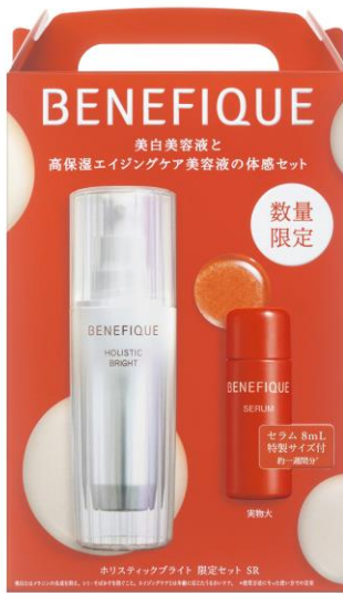
【ベネフィーク ホリスティックブライト 限定セット SR(医薬部外品)】