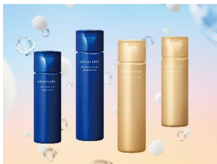
(左から)アクアレーベル トリートメントミルク・トリートメントローション(ブライトニング) トリートメントローション・トリートメントミルク(オイルイン)

※1 4-メキシサリチル酸カリウム塩 ※2 ツボクサエキス ※3 D-グルタミン酸、DL-アラニン、DL-メチオニン ※4 本体重量比