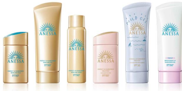
左から アネッサ パーフェクトUV スキンケアミルク NA / アネッサ パーフェクトUV スキンケアジェル NA アネッサ パーフェクトUV スキンケアスプレー NA / アネッサ パーフェクトUV マイルドミルク NA アネッサ ミネラルUV マイルドジェル / アネッサ ブライトニング UVジェル N (医薬部外品)