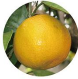
ウンシュウミカン エキス