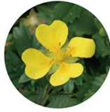
トルメンチラ根 エキス