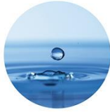
PEG / PPG-14 / 7ジメチルエーテル