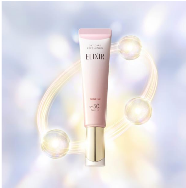
エリクシール デーケアレボリューション トーンアップ SP+ aa