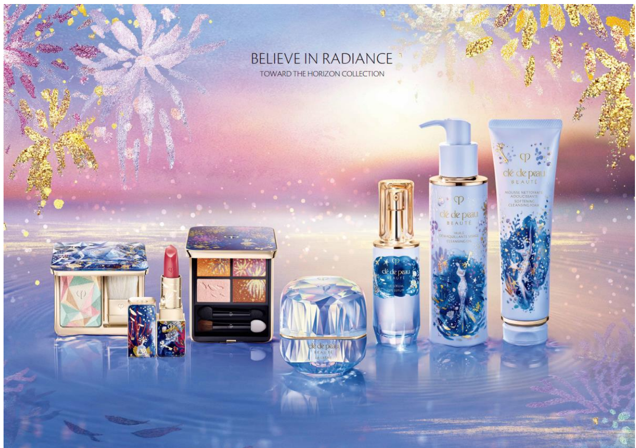
【クレ・ド・ポー ボーテ 2023 ホリデーコレクション】

本限定品は、全国の百貨店約200店、化粧品専門店約1,800店にて数量限定発売します。 ※価格は参考小売価格です(店舗によって異なる場合があります)