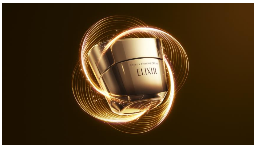
エリクシール トータルV ファーミングクリーム