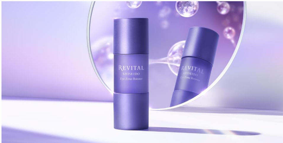
【リバイタル アイゾーンブースター】