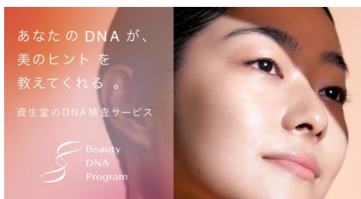
Beauty DNA Program キービジュアル

当社は2030年に「PERSONAL BEAUTY WELLNESS COMPANY」として、生涯を通じて一人ひとりの自分らしい健康美を実現する企業を目指しています。パーソナライズサービスであるBeauty DNA Programを通じて、お客さまの生活習慣をより良いものとし、心身ともに美しく健やかな未来へと伴走するとともに、引き続きデジタルを活用し、お客さまがいつでも・どこでも・欲しい時に「テイラーメイドなオンリーワン体験(一人ひとりのニーズにあった美容体験)」を提供し、お客さまの満足度向上と、長期にわたるエンゲージメントを深めていきます。