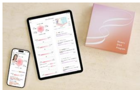
検査結果イメージ