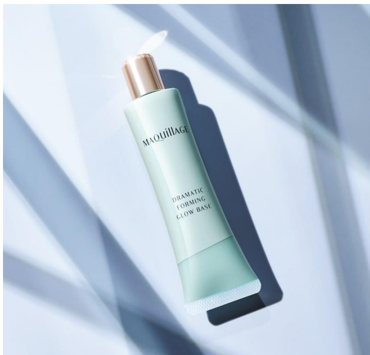
マキアージュ ドラマティックフォルミンググロウベース