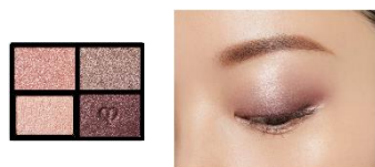
3 Sundried Driftwood