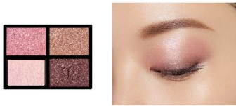
9 Pink Coral Shells