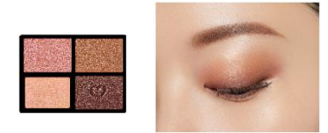
7 Starlight Splendor