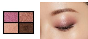
6 Caviar Pearls