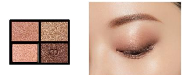
5 Coral Reef