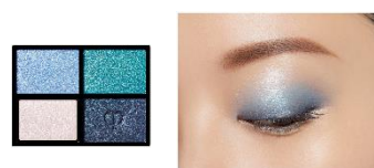
11 Azure Blue Sea