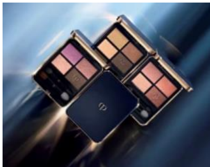
【クレ・ド・ポー ボーテ オンブルクルールクアドリ】