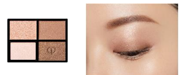
2 Beach Pebbles