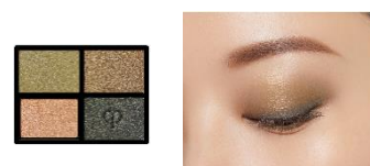
10 Sea Grass