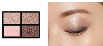
1 Sand Dune