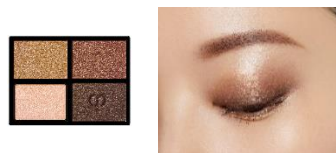
4 Ocean Sunrise