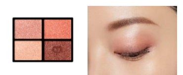
8 Warm Ocean Sunset

色彩や輝きの原点である「光」がエンパワーする魅惑的なグラデーションで目もとに奥行き感が生まれ、品格のある仕上がりになります。