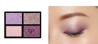
12 Purple Ocean Twilight