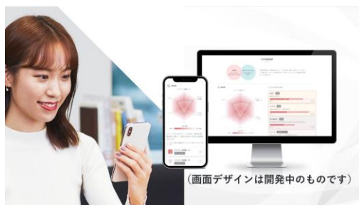
「Beauty DNA Program」

中でも、新型コロナウイルス感染症で変化したお客さまニーズに対応し、満足度を向上させ、長期にわたりエンゲージメントを深めるために導入したのが、高度な顔認証技術と AI 技術によるバーチャルメイクアップを搭載した国内初の Web カウンセリングや、AI 技術を用いた独自の DNA 検査結果をもとに最適なケアを提案する「Beauty DNA Program」、お客さまの情報を One ID 化し、OMO の顧客体験を実現する「Beauty Key」などです。当社の 150 年以上にわたる美の知見と最新の DX の融合により、いつでも・どこでも・お客さまが欲しい時に「テイラーメイドなオンリーワン体験(一人ひとりのニーズにあった美容体験)」を実現します。