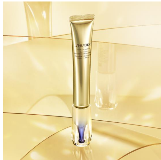
SHISEIDO バイタルパーフェクション リンクルリフト ディープレチノホワイト 5 (医薬部外品) 【発売中】