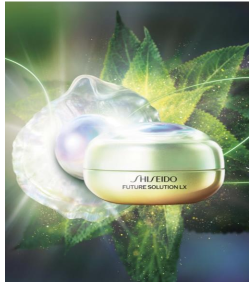
SHISEIDO フューチャーソリューション LX レジェンダリーEN ブリリアンスアイクリーム(医薬部外品) 【2023年7月1日新発売】