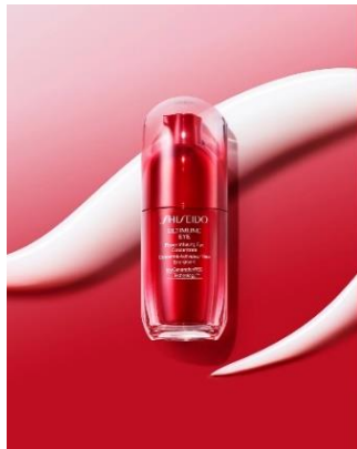
SHISEIDO アルティミュン™ パワライジング アイ コンセントレート III