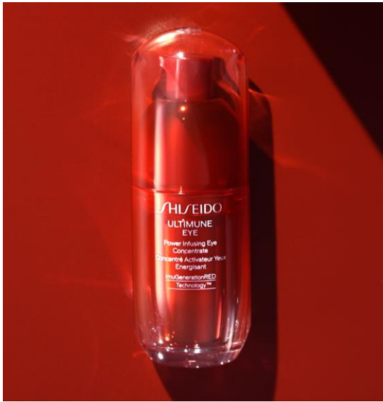
SHISEIDO アルティミュン™ パワライジング アイ コンセントレート III 【2023年7月1日新発売】

目まわりが顔の印象に大きく寄与することに着目し、SHISEIDO は 3 つの目元ケアアイテム「アルティミュン™ パワライジング アイ コンセントレート III」、「ベネフィانس リンクル スムージング アイクリーム N」、「フューチャーソリューション LX レジェンダリーEN ブリリアンスアイクリーム(医薬部外品)」を 2023 年 7 月 1 日(土)に新発売します。既存品の「バイタルパーフェクション リンクルリフト ディープレチノホワイト 5 (医薬部外品)」を加えた 4 アイテムで、あらゆる目もと悩みに対応する目もとケアを提案します。