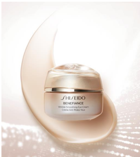
SHISEIDO ベネフィانس リンクル スムージング アイクリーム N 【2023年7月1日新発売】