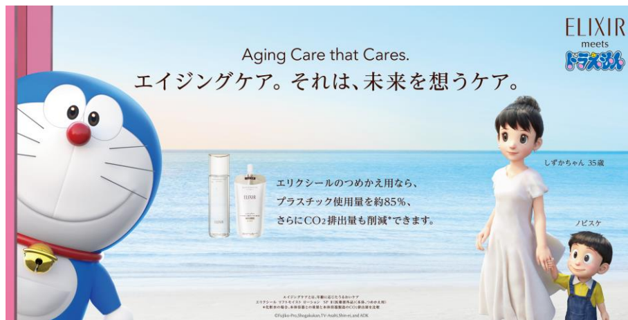
2023年 エリクシール グローバルサステナビリティキャンペーン キービジュアル

2012年の発売以来、エリクシールのつめかえ用の普及率は着実に上がっており、累計3,000万個以上 ※6 を販売しています。これによって、1,880トン以上 ※7 のプラスチック量を削減しています。なお、この活動は日本のみならず、アジアの国・地域全体に拡大し、2025年までにはエリクシールの主力商品はすべて、つめかえ(つけかえ)対応することを目指しています。