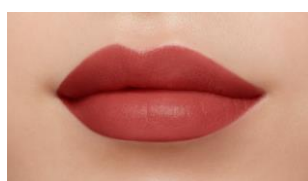
しなやかな唇を演出 ルージュクレーム マット