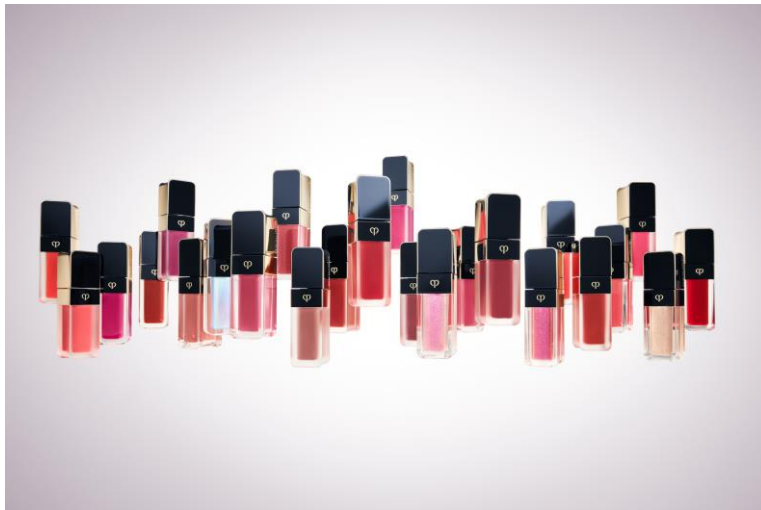
【クレ・ド・ポー ボーテ ルージュクリーム プリアン/マット/エタンスタン】