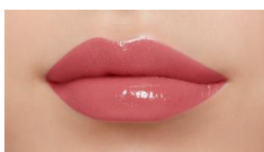
ふっくらとした唇を演出 ルージュクレーム ブリアン