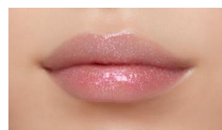
立体的な唇を演出 ルージュクレーム エタンスラン