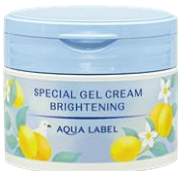
アクアレーベル スペシャルジェルクリーム(ブライトニング) O (医薬部外品)

「アクアレーベル スペシャルジェルクリーム(ブライトニング) O」は、春夏の肌悩みを心地よくケアできる、美白ケアオールインワンの数量限定品です。塗った瞬間ひんやり心地よく、爽やかなレモンの香りで、快適にシミ予防ができ、より引き締まった実感を高める使用法で、すっきり快適、まるで美白エステ気分を味わえます。容器には、爽やかさを感じさせるレモンのイラストと、22年5月に発売した「スペシャルジェルクリームクール」に続き、季節の鳥をあしらっています。今年は、南極周辺に生息するユキドリを採用し、涼しげな様子・さわやかさをデザインに表現しています。