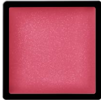
PK451 フランボワーズソース 熟れた果実のような ジューシーピンク