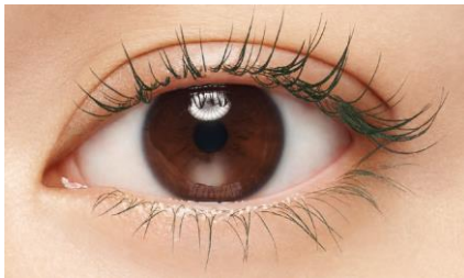
※仕上がりがイメージ(個人差があります)