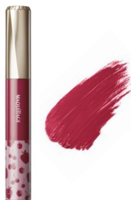
RS551 アメリカンチェリー つややかで深みのある ディープローズ