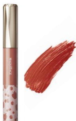
OR552 アプリコットオレンジ つややかで深みのある ディープオレンジ