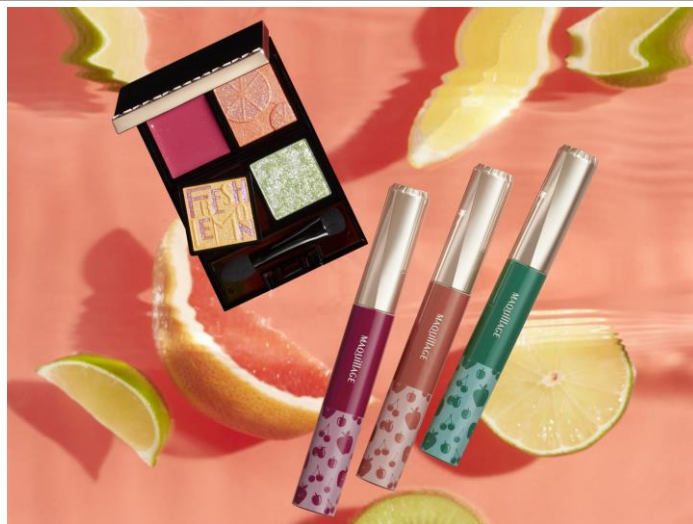
マキアージュ ドラマティックアイカラー&amp;エッセンスマスカラ（限定カラー）