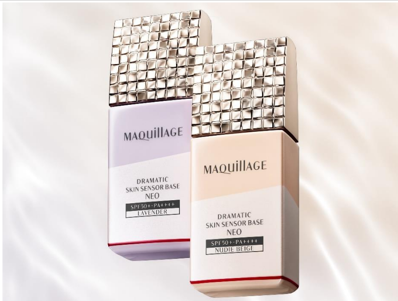
マキアージュ ドラマティックスキンセンサーベース NEO(ヌーディーベージュ/ラベンダー)