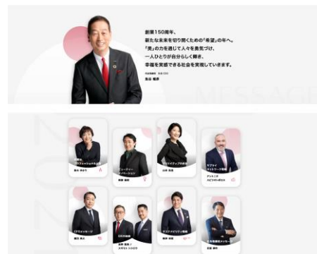
統合レポート メッセージ