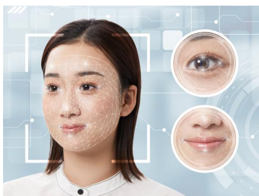
マキアージュ パーソナルビューティーチェック キービジュアル

*顔の3次元形状を測定し、目周りの凹凸感や、頬からフェイスラインにかけての骨格感の特徴と全体のバランスから顔のタイプを判定する顔解析機能を搭載したメイクアップ web コンテンツ(技術俯瞰解析ソフトウェア VALUENEX Radar(VALUENEX 株式会社)による先行市場調査(2018年7月-2022年8月対象))