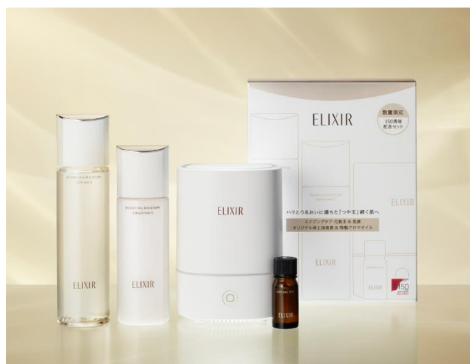
150周年記念セット エリクシール【数量限定品】