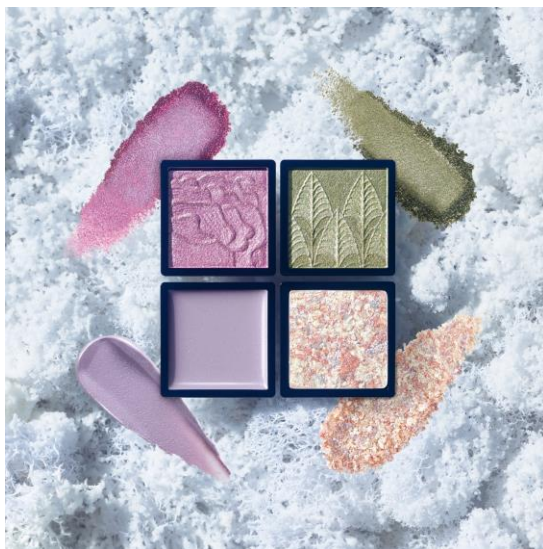
左上 ドラマティックアイカラー (パウダー) RS452(アイスフラワー) 右上 ドラマティックアイカラー (パウダー) GR353(ミステリアスリーフ) 左下 ドラマティックアイカラー (クリーム) VI151(ミルクオーロラ) 右下 ドラマティックアイカラー (パウダー) SV854(ダンシングスノーシュガー)