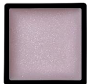
VI151 ミルクィオーロラ ふんわりニュアンスのオーロラバイオレット