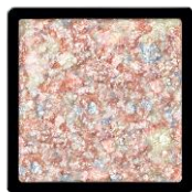
SV854 ダンシングスノーシュガー 虹色に輝くダイヤモンドダストシルバー