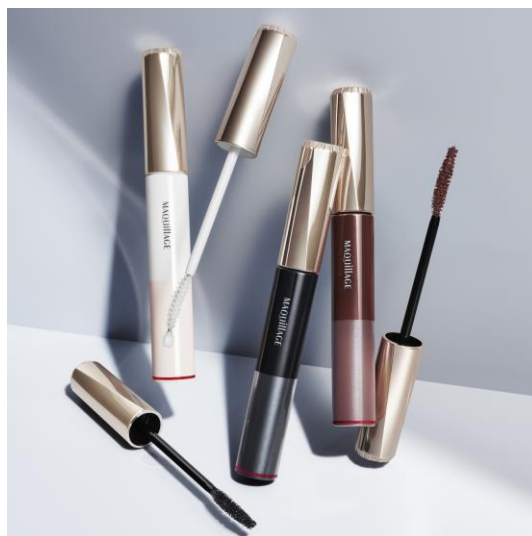
右から マキアージュ ドラマティックエッセンスマスカラ（ロング&カール） ドラマティックアイラッシュエッセンス

※1 アルギニン・スーパーヒアルロン酸(アセチルヒアルロン酸 Na)・アミノ酸系フィトステロール(毛髪保護・補修)・ツバキオイル(毛髪つや)