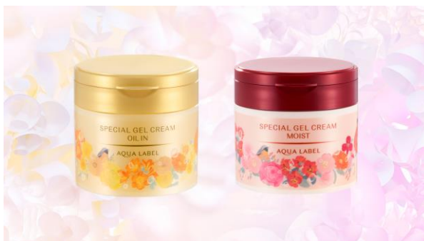
左:アクアレーベル スペシャルジェルクリーム A (オイルイン) L 右:アクアレーベル スペシャルジェルクリーム N (モイスト) L

※2 インテージ SRI,SRI+ セルフオールインワンスキンケア市場(洗顔・メイク落とし除く)2013 年 1 月～2021 年 12 月 推計販売規模(金額)ブランドランキング